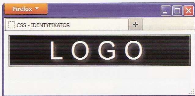
Rys. 18.3. Stronna WWW stworzona na podstawie list. 18.5 (HTML) i list. 18.6 (CSS)

div#logo { background-color: black; color: white; font: 50px arial; text-align: center; text-shadow: silver 4px 4px 8px; border: double silver; letter-spacing: 15px; }